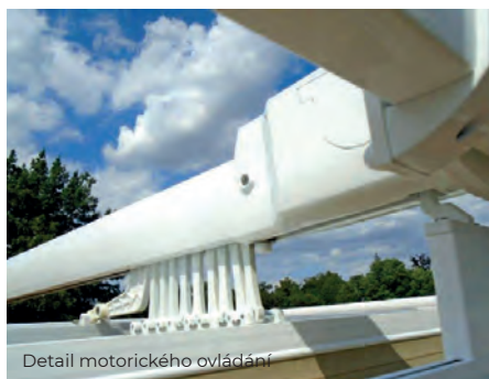
Detail motorického ovládání

Samostatně stojící, ovládání lanovým převodem